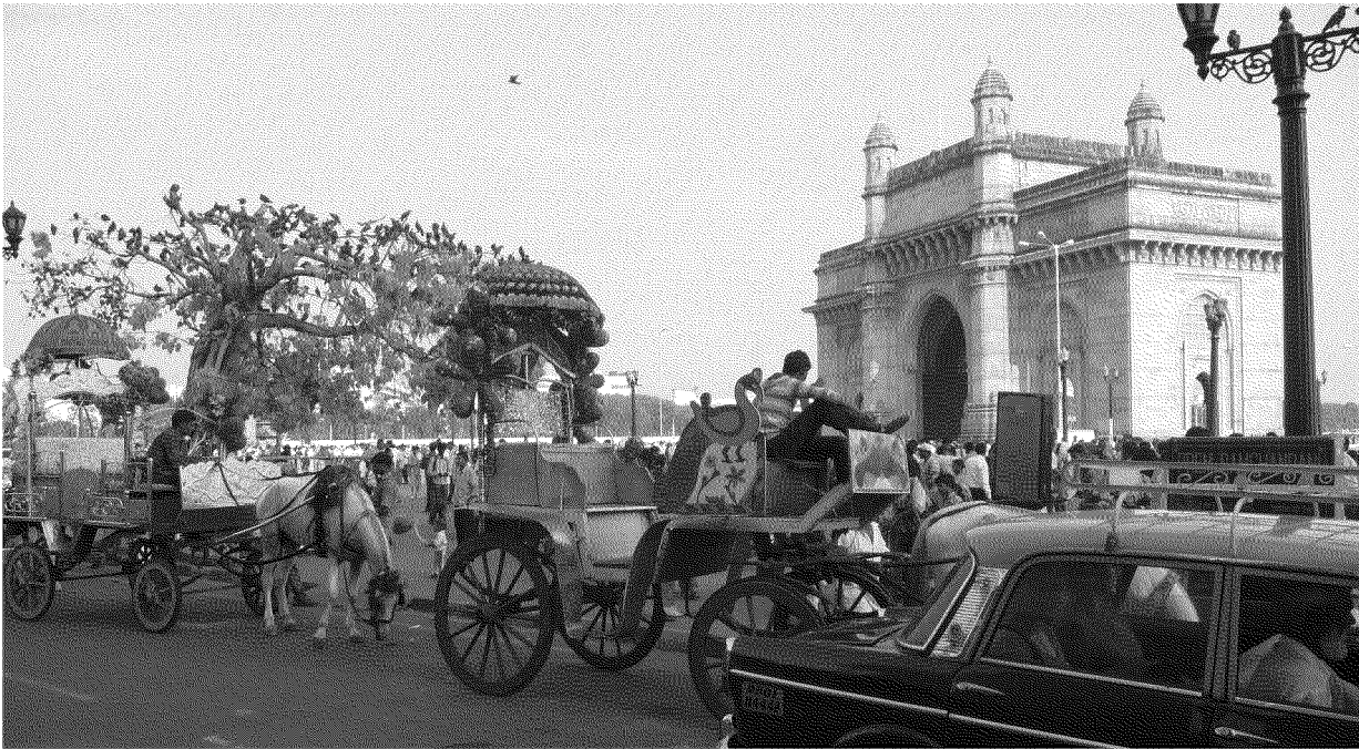
CONTRASTI Taxi, biciclette e carrozze trainate da cavalli sotto il Gateway of India, simbolo della città